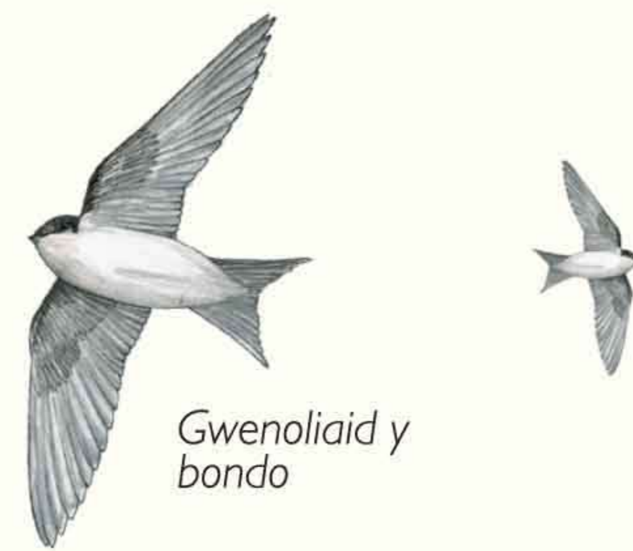
Gwenoliaid y bondo

Mynediad: Mae'r llwybr o'r maes parcio i Barc Capel y Waun ac o amgylch y parc yn addas i gadeiriau olwyn a chadeiriau gwthio (edrychwch ar y map). Ond mae rhannau o'r llwybr drwy'r coetir yn anwastad ac mae'n gallu bod yn fwdlyd mewn manau.